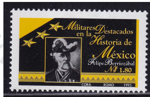
Fig. 5 Felipe Berriozábal