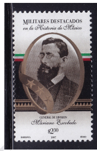
Fig. 3 Mariano Escobedo