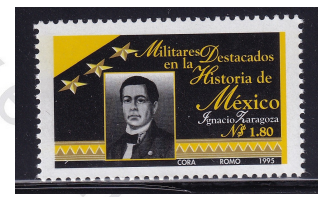
Fig. 4 Ignacio Zaragoza