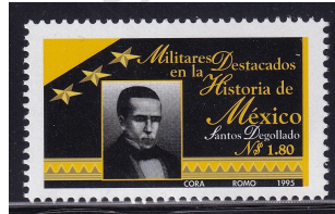
Fig. 2 Santos Degollado