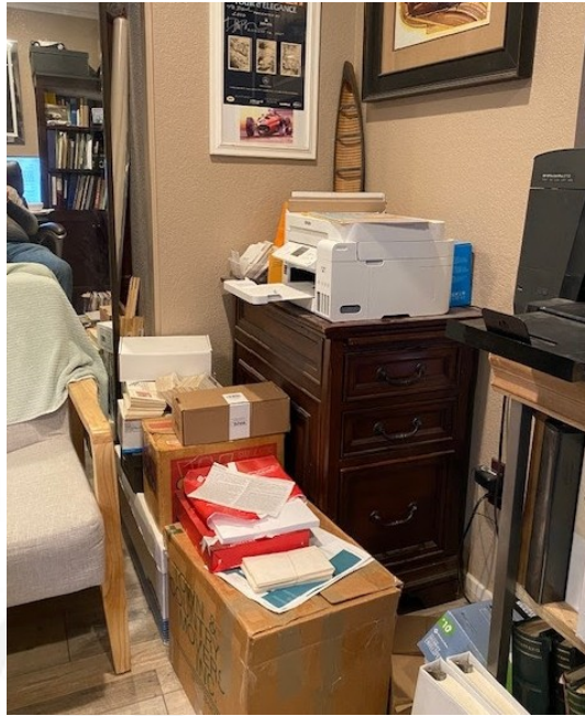
Desorden de oficina

Una cosa buena de mi manera de ser un Sloppy Joe es que estoy perdido en la dicha de simplemente jugar con mis sellos. Dios sabe cómo he sido capaz de publicar cincuenta o sesenta lotes de eBay por semana, está más allá de mi comprensión. Ya no hago muchos. A finales del año pasado supe el toque de campana de mi negocio de sellos. Ahora toca relajarse, dejar espacio para pintar un cuadro, ver un programa de televisión por la tarde, pasear a los perros, jugar con estampillas y responder correos electrónicos. Lo divertido ahora es seguir escribiendo y brindando mi enfoque, a veces extravagante, para recopilar y brindar información experta que a menudo aprendo de la manera más difícil. Entonces, ahora, si mi oficina parece un desastre, realmente no me importa porque sigo siendo yo divirtiéndome..