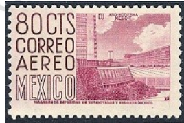
Fig. 16, Arquitectura 1950