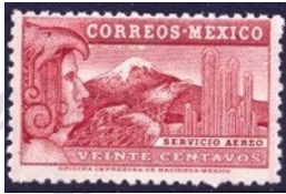
Fig. 15, Motivos 1934

Toman más fuerza y duración las series permanentes, esta época contiene 5 de ellas: Monumentos en 1923 ( Figura # 14 ), Motivos Mexicanos en 1934 ( Figura # 15 ), Arquitectura y Arqueología en 1950 ( Figura # 16 ), México Exporta en 1975 ( Figura # 17 ) y México Turístico en 1993 ( Figura # 18 )