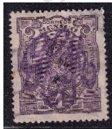
Fig. 10, GCM grande 1914