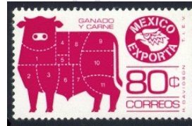
Fig. 17, Exporta 1975