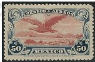
Fig. 13, Aéreo 1922

La aparente finalización de las pugnas sociales que dieron origen a la Revolución Mexicana y un intento fallido de iniciar el servicio postal aéreo en 1922, fueron la justificación para que los filatelistas dieran término a la “Epoca Revolución” y por ende al inicio de la “Epoca Moderna” que su razón de haberla llamado así pudo haber estado relacionada con lo del servicio aéreo, sin embargo, curiosamente y a pesar de haberse impreso las estampillas correspondientes a este servicio en 1922 ( Figura # 13 ), fue hasta 1927 cuando se implementó, y se imprimen las estampillas definitivas para ese servicio. Por esta historia, es que debemos considerar que las estampillas que dieron inicio a esta época son entonces las identificadas como “Serie Monumentos” de 1923 ( Figura # 14 ).