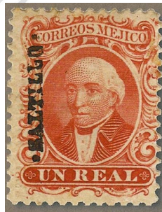
Fig. 4: Hidalgo 1864

En esta época, todos los sellos fueron impresos en México, salvo dos excepciones: a) en 1864, los llamados “Hidalgo de Juárez” ( Figura # 4 ) que se imprimieron en Estados Unidos de America, y b) en 1874, los “Hidalgo del 74” ( Figura # 5 ) que iniciaron imprimiéndose en Estados Unidos de América y terminaron en sus últimos años imprimiéndose en México, usando las mismas placas pero diferente papel.