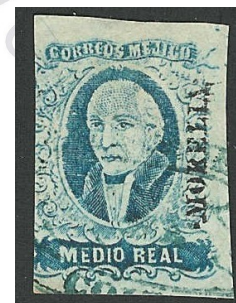
Fig. 3: México 1856

El territorio carecía de buenas vías de comunicación y de seguridad en las mismas, por lo que las probabilidades de robo en el proceso de distribución a las diferentes oficinas principales de cada distrito postal, eran altas. En ese