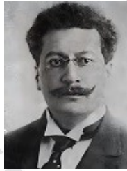
Ricardo Flores Magón