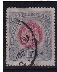
Fig. 7: Aguilas Porfirianas 1899

Prácticamente en toda esta época, el país es gobernado por Porfirio Díaz, donde contrastan por una parte la estabilidad de gobierno que permite un desarrollo económico sin precedente, y por la otra, una población marginada por el distanciamiento que mucho se debió a la falta de preparación de las clase populares, que con solo advertir que el 75% de la población era analfabeta en 1910, podemos imaginarnos la distancia entre los extremos sociales, y que a pesar del crecimiento de las vías de comunicación ( caminos, puentes, vías, telégrafos, etc ), mucha población no tenía posibilidades de incorporarse al progreso, pues era una tarea muy difícil para el gobierno, el poder cumplir con sectores tan heterogéneos, como lo son: inversionistas extranjeros, población sin preparación, y empresarios nacionales intermedios. Podemos resumir esta semblanza con los tres puntos siguientes: