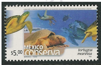
Fig. 19, Conserva 2002

Se ve nacer a 3 nuevas series: México Conserva en 2002 ( Figura # 19 ), Creación Popular en 2005 ( Figura # 20 ) y finalmente Arte Textil en 2023 ( Figura # 21 )