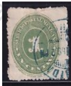
Fig. 6, Numeral 1886

Las estampillas siguen imprimiéndose en México, con mejor calidad en las viñetas o gráficos, pero con un desmerecimiento fuerte en las perforaciones ( Figura # 6 ), y es en 1899 que se vuelven a importar pues se mandan a imprimir a Inglaterra (Figura # 7 ) y continúa hasta 1910 con la serie “Centenario de la Independencia” .