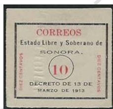
Fig. 8, Sonora Blanco 1913

Oficialmente el movimiento revolucionario se considera que empezó en 1910, sin embargo, la comunidad filatélica optó por iniciar esta época en el momento que se emite la primer estampilla que en su diseño alude a la revolución misma, y ésto sucedió en junio de 1913 cuando el gobierno de Sonora emite la estampilla apodada “Los Sonora Blancos” ( Figura # 8 ) , posterior al asesinato de Francisco I Madero, acto que ocasionó que los gobernadores de Sonora, Chihuahua y Coahuila se proclamaran por no reconocer al gobierno federal de Victoriano Huerta. La última estampilla emitida en la Epoca Antigua, había sido en 1910 para conmemorar los 100 años de la Independencia.