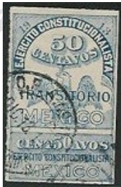
Fig. 9, Ejércitos 1913