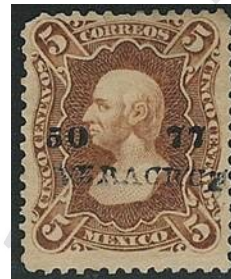
Fig. 5: Hidalgo 1874

En esta Epoca Clásica, México vive varios eventos históricos importantes que empezarán a definir un perfil de nación, y que impactarán directamente en las emisiones de las estampillas postales contemporáneas a la época. Aquí se mencionan los más importantes para el desarrollo de este tema: