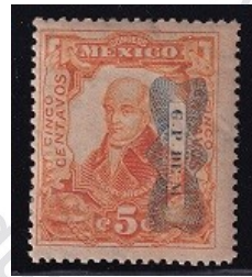
Fig. 11, GPM Corbata 1916