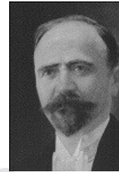
Francisco I Madero