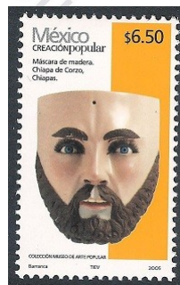
Fig. 20, Creación Popular 2005