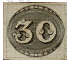
Fig. 2: Brasil 1843