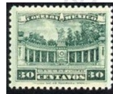
Fig. 14, Monumentos 1923

Las luchas de poder continuaron todavía algunos 12 años más, lo cual no permitió que los planes plasmados en la Constitución de 1917 hubieran iniciado. Posiblemente fue hasta 1934, con la llegada al poder de Lázaro Cárdenas, que la población comenzó a ver los inicios de los cambios prometidos. Muchos de estos cambios, es fecha que no han dado inicio, y por eso podemos decir que el desarrollo socio económico de México en esta Epoca Moderna, comparado con otras sociedades semejantes, ha sido mucho más lento. El despegue económico de México tardaría todavía unos 60 años más, hasta que se abrió la economía internacionalmente, a pesar que en materia de auto gobierno, sigue arrastrando vicios que han costado muy caro a la sociedad mexicana.