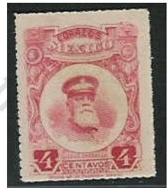
Fig. 12, Hombres Ilustres 1917