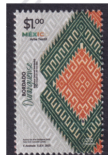
Fig. 21, Arte Textil 2023

Algunos de los principales protagonistas de esta época son: