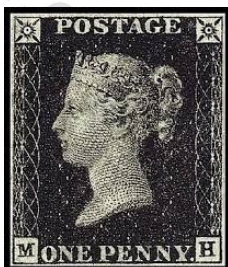
Fig. 1: Inglaterra 1840

Aunque México ya era un país independiente, no se había podido establecer un sistema de gobierno estable, y por lo mismo había una falta de nacionalismo y de orden gubernamental. Sin embargo, en esos momentos los ingresos por los servicios postales eran muy importantes, y el uso de las estampillas venía a proporcionar un mejor control sobre dichos ingresos, y es por eso que México inicia el uso de las estampillas postales, siendo que éstas habían empezado a usarse en Inglaterra en 1840 ( Figura # 1 ), y el primer país en América en utilizarlas había sido Brasil en 1843 ( Figura # 2 ), por lo que México en 1856 ( Figura # 3 ) fue el noveno país en América en hacerlo.