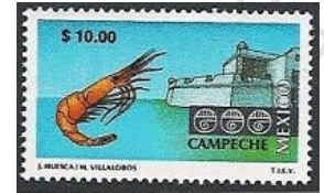
Fig. 18, Turístico 1993

Algunos de los principales protagonistas de esta época fueron: